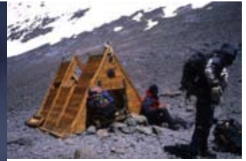
◀ Arrivée au sommet du toit des Amériques par la voie des Polonais. Ut wisi enim ad minim veniam, quis nostrud exerci tation ul- lam corper suscipit lobortis.

sensation qui réduit même les plus performants à l'abandon. Il faut compter dix à quinze jours à partir de 4200 m pour que la majorité des personnes non habituées à ce genre d'aventure s'adaptent à l'altitude.