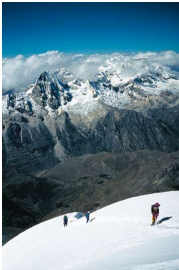
► Vers le sommet du Chopicalqui à 6150m et le Cerros Ulta et Chugllaraju. Towards the summit of Chopicalqui at 6,150m and the Cerros Ulta and Chugllaraju.